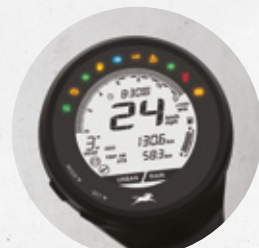
Panel digital con SmartXconnect